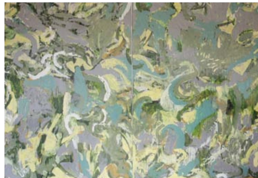
El río interno

Díptico. Técnica mixta sobre papel reaprovechado. 140 x 200 cm