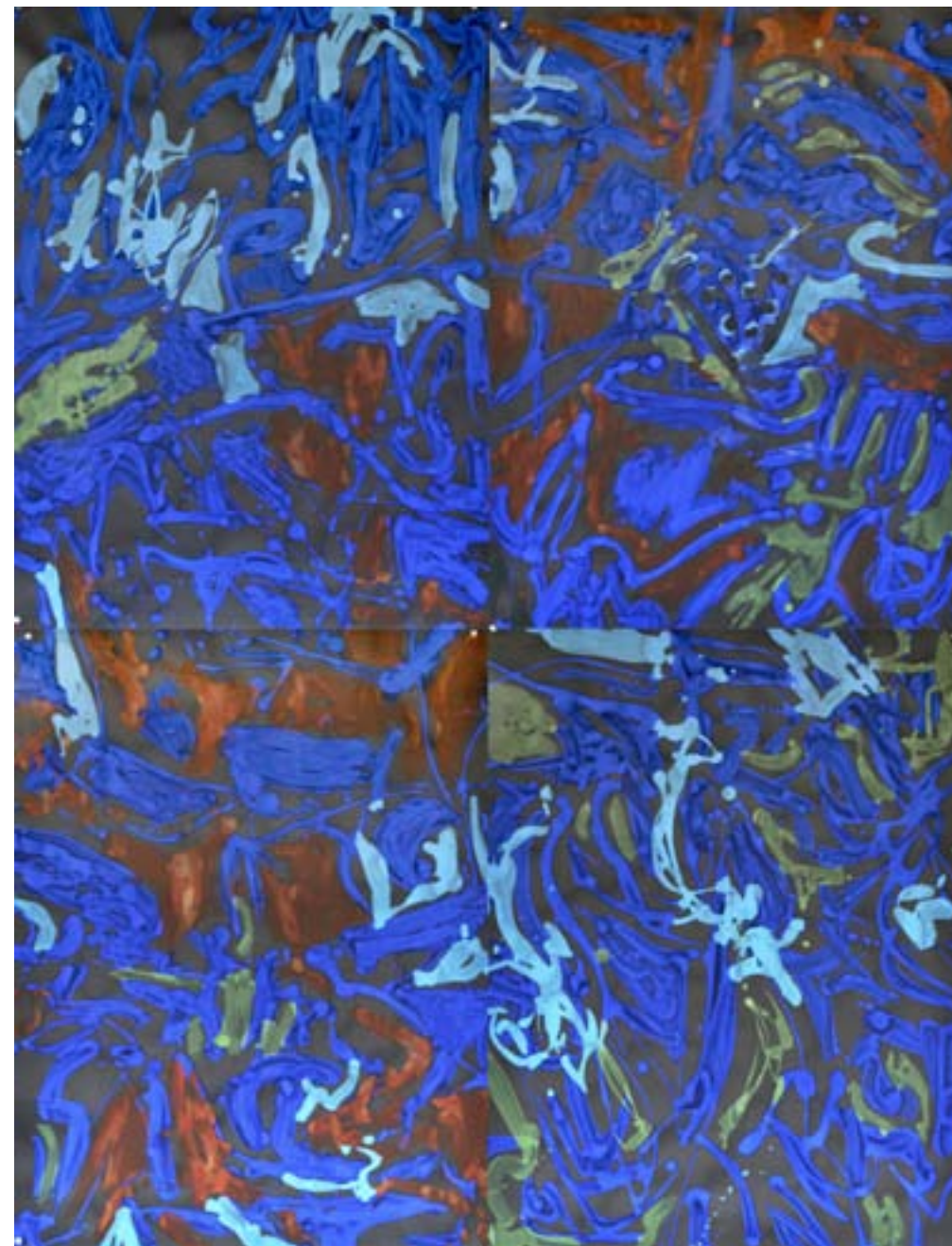
Presagio 8 Políptico. 4 unidades. 129 x 100 cm. total. Técnica mixta sobre papel Canson negro 110 gr.