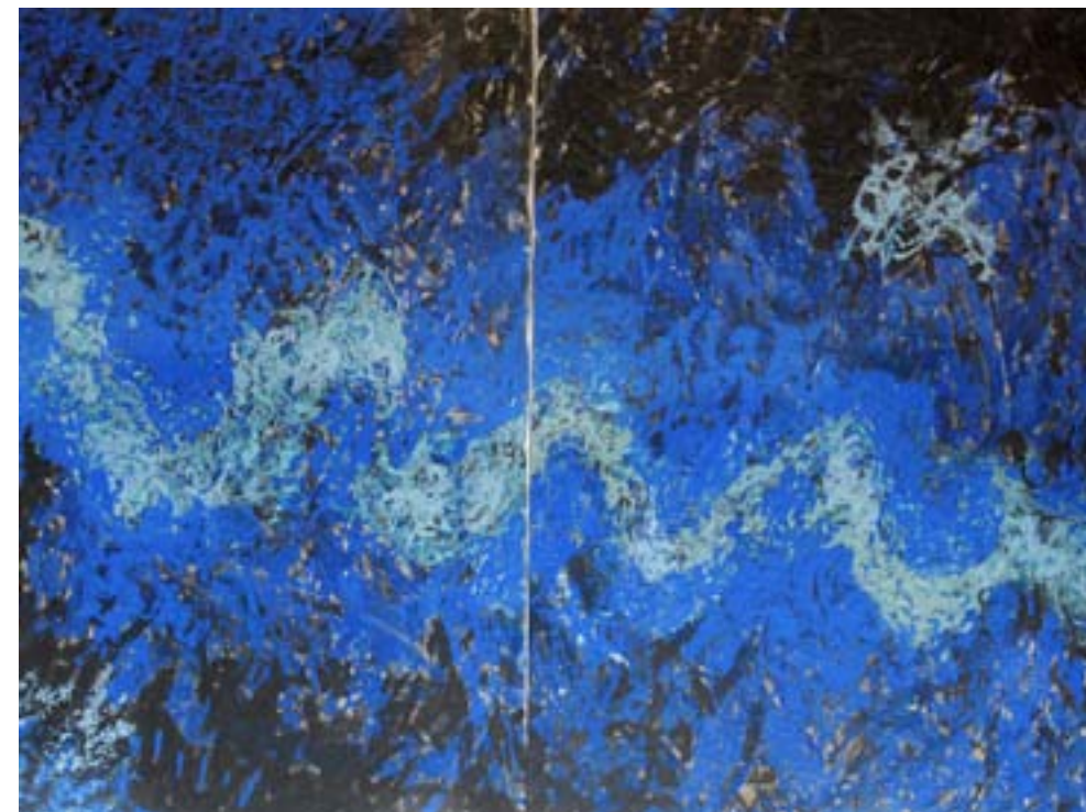
Las ninfas se han ido

El negro como base juega, en este caso, a dos niveles: por una parte, interaccionando con cualidades expresivas entre el conjunto de formas, líneas o manchas de color como un elemento más del juego plástico planteado y, por otra, como base simbólica determinante de todo el colorido en su conjunto. Ciertos colores puros y, en ocasiones, usados en gamas contrastantes ven parte de su luz absorbida por la fuerza oscura de los fondos, adquiriendo unos tintes grisáceos y sutilmente ambiguos, tanto más cuanto más transparentes son, mutando lo que debería ser su apariencia “normal” en plasmaciones de carácter un tanto “fantasmagórico”. Pero también, en contrapunto con la negritud, otros colores o tonos deciden alcanzar una nueva dimensión que tiene algo de electrizante, unas calidades fosforescentes muy expresivas de un mundo que parece habitar en las profundidades, debatir su gestualidad en los abismos de lo insondable, a veces demostrando su rabia, otras, simplemente, abandonándose a las vicisitudes de un destino que no es elegido, que juega sus cartas sin contar con nosotros.