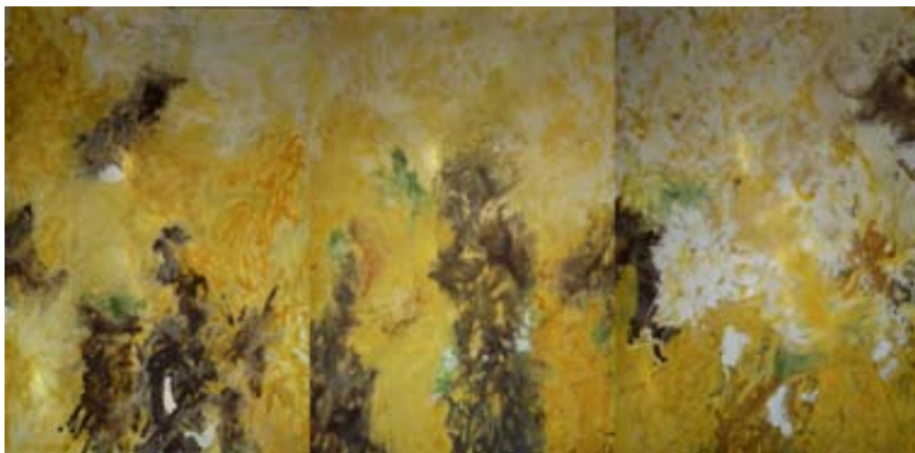
Presagio 4 Tríptico. Técnica mixta sobre papel de algodón. 150 x 300 cm.